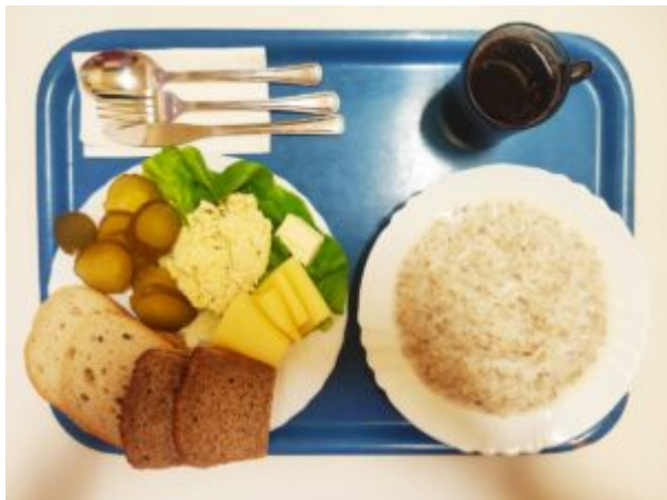
Śniadanie z ograniczeniem łatwo przyswajalnych węglowodanów