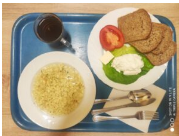
Śniadanie dieta z ograniczeniem łatwo przyswajalnych węglowodanów